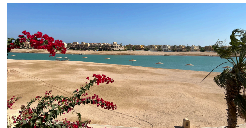
El Mar Rojo