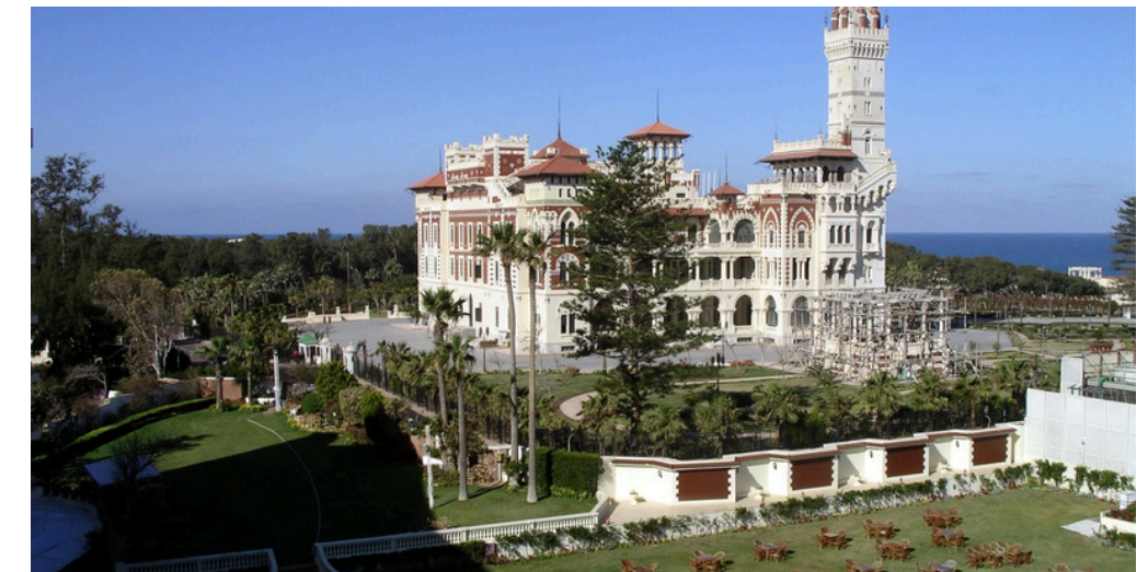
Jardins de Montaza