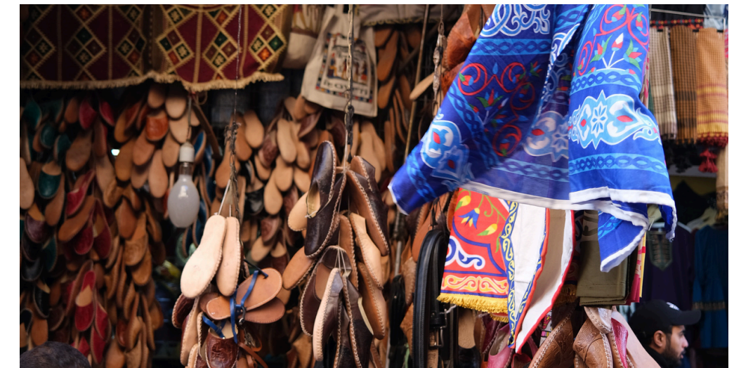
Souk Khan Al Khalili