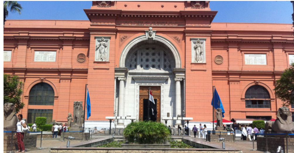
Musée des antiquités