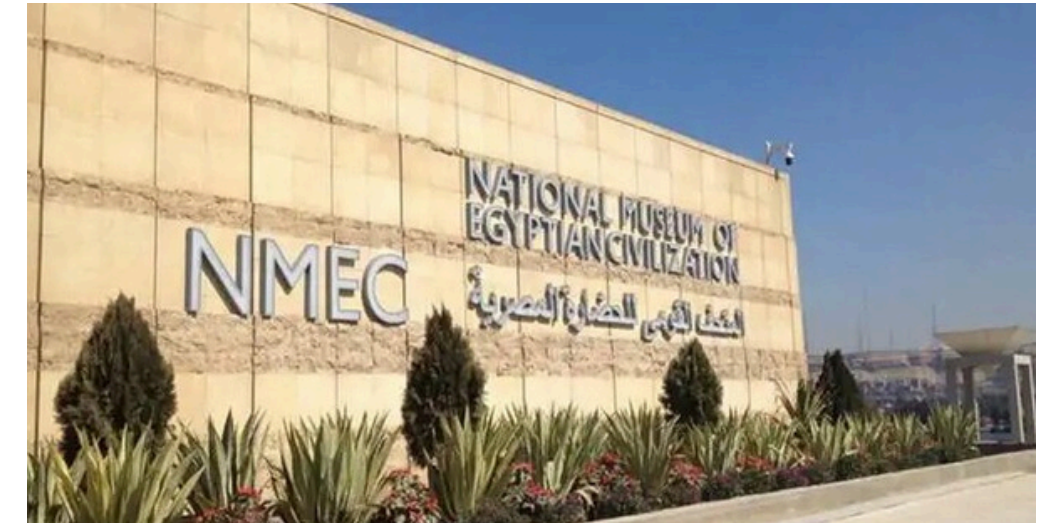
Musée de la civilisation