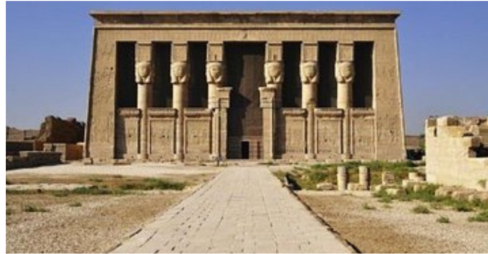
Templo de Denderah