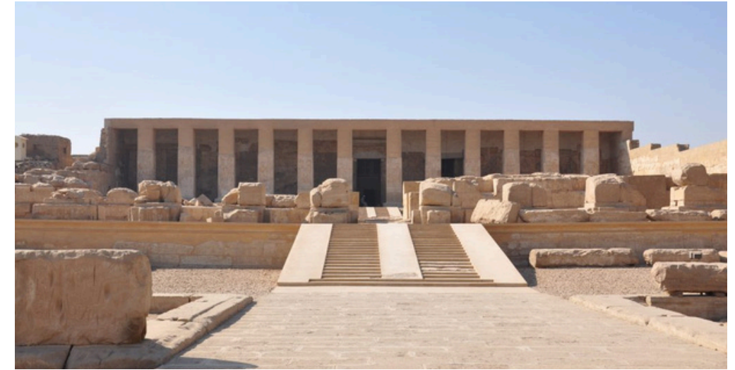
Templo de Abydos