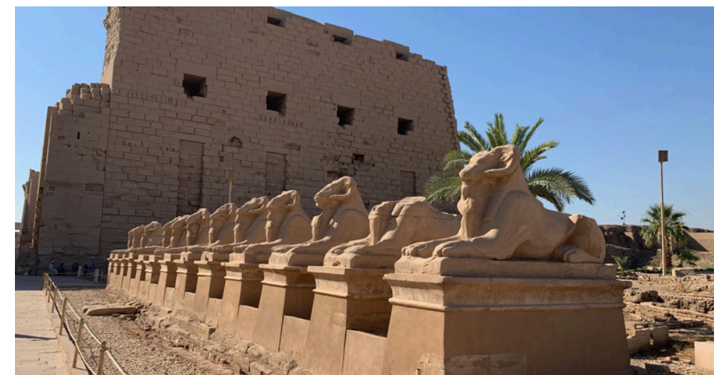
Tous les temples majeurs