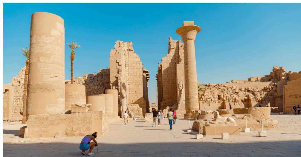
Templo de Karnak