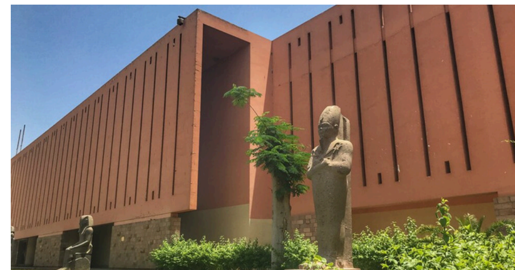
Museo de Luxor