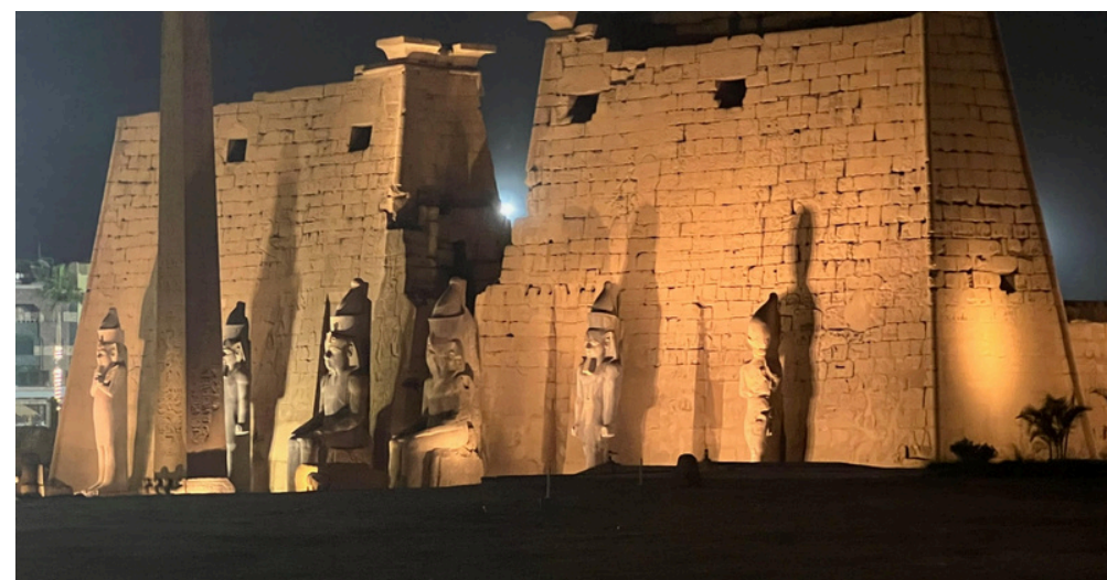
Temple de Louxor