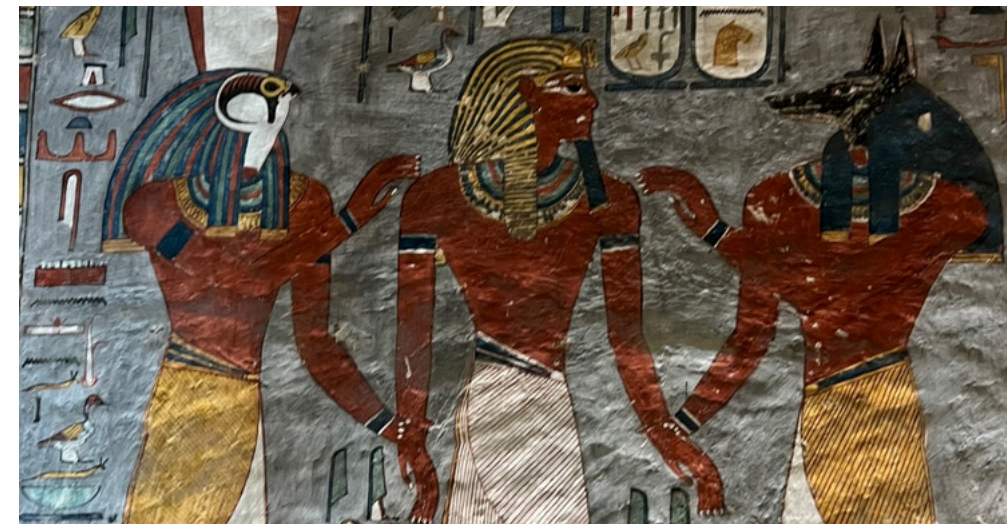
Valley of the Kings