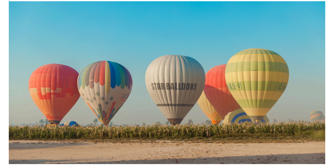
Hot Air Balloon