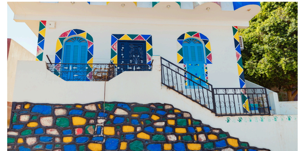
1 nuit au village nubien