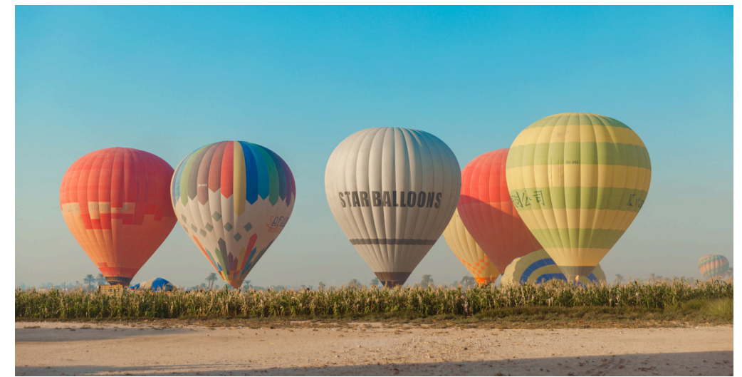
Hot Air Balloon