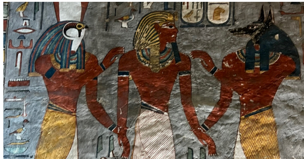
Valley of the Kings