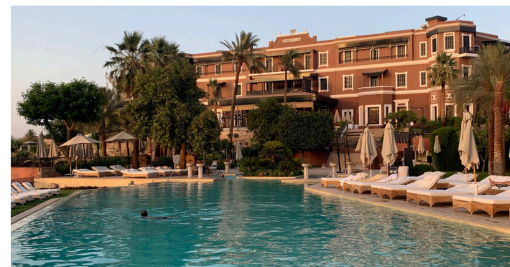
Hôtels 5 étoiles luxe